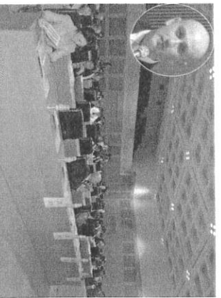
写真左は開会の経歴者や投資家ら。ト・タニエト支所長